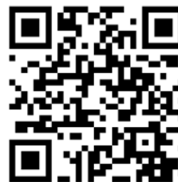
城市科學實驗室官網